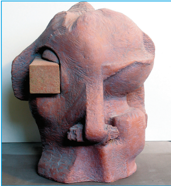
פסל אקספרסיבי מטרקוטה צבועה נחום ענבר, ביה"ס לאמנות ספירטק, המכללה האקדמית ספיר