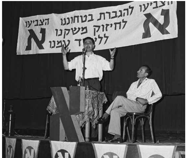
שמעון פרס, תל אביב 1959