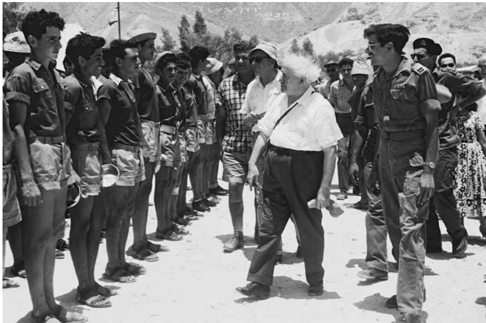
ביקור ראש הממשלה דוד בן-גוריון בבסיס הגדנ"ע החקלאי באר אורה, 1957