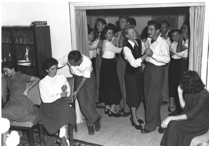
מסיבת ריקודים סלוניים, תל אביב, סוף שנות הארבעים

אני לא רוצה שתסתכל רק על הקצינים. אני מחנך את הבנים של צהלה, ואני רואה איך נראים הבנים שלהם, איזו זיקה של שליחות יש לבנים של צהלה: חברות סלוגיות, כל הדברים הפסולים ביותר שיכולים להיות, ואלה הבנים של הקצינים שלנו. אני חושב שאתה מתעלם מזה. לפעמים אני לא יודע אם אתה מתעלם מזה ביודעין או לא ביודעין. לדעתי זו סכנה מאוד רצינית. ואם מפא"י לא תשים לב לדברים אלה – בסוף תיפול. 78