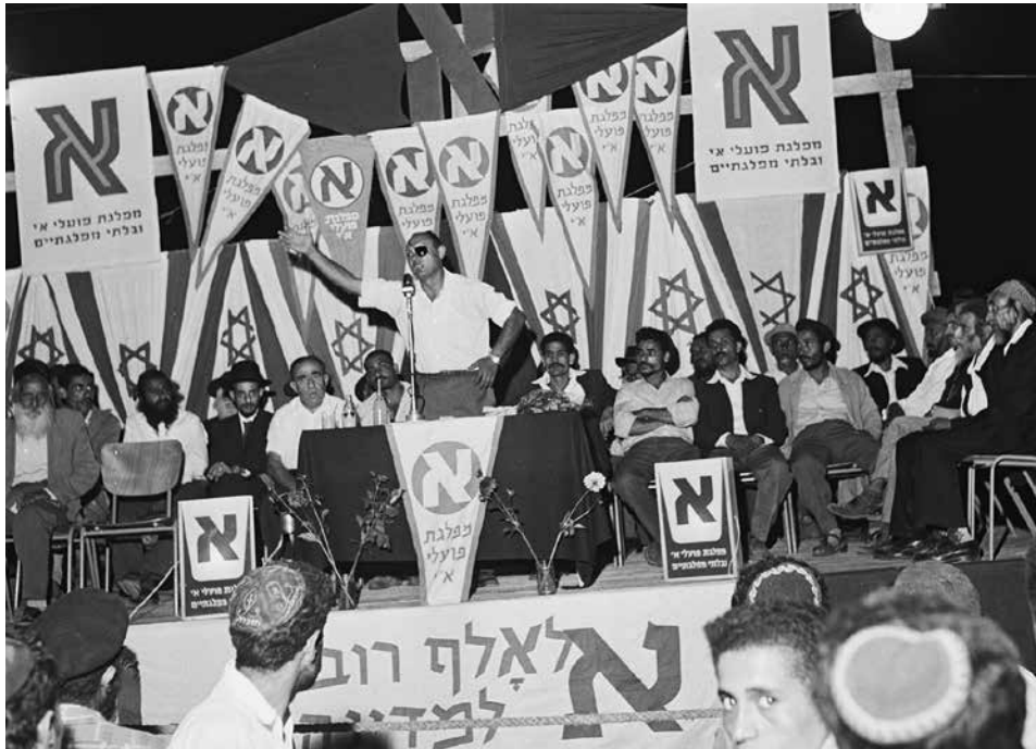
משה דיין נואם במערכת הבחירות לכנסת הרביעית, אוקטובר 1959

עם ותיקים אבל אלה לא יאריכו עוד ימים. 25 לא לכריאותם ולכושר תפקודם של הוותיקים דאג בן-גוריון, שהרי היה מבוגר מהם. במישור הפנים-מפלגתי היה הדיון שהתקיים במוסדות מפא"י בקיץ 1960 עוד גלגול במחזור החיכוכים הפוליטיים הבין-דוריים שראשיתם הממוסדת עם הקמת המשמרת הצעירה במפא"י בספטמבר 1944. 26 בהקשר של הפרשה ההיסטורית שבמוקד עיוני התמוגג דיון זה עם מחלוקת מהותית על עיצוב המציאות הישראלית וסדרי העדיפויות של תנועת העבודה בעשור השני לקיומה של המדינה. מסורת הגמישות הפוליטית, ההימנעות מקיבעון תקנוני וריבוי הגופים מקבלי החלטות במפלגה, שירתו מחד גיסא צרכים ארגוניים-מגננוניים אפרוריים, שזוהו בתקופה הנדונה כאן עם התארגנות בלתי פורמלית שכונתה 'הגוש', ומאידך גיסא הגבירה מציאות זו את מידת השליטה וההשפעה של בכירי מפא"י על עיצוב המדיניות בעיתות שגרה ומשבר. 27