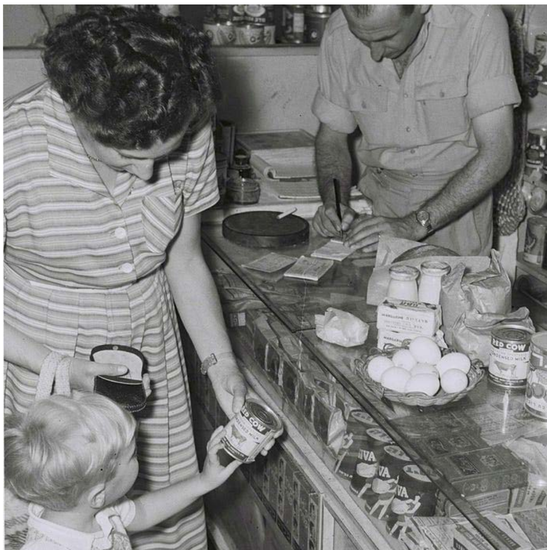
חלוקת מזון, ב-1949. ערכים של צניעות והסתפקות במועט