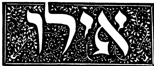
Abbildung 2. Type Sonzino (gedruckt Lissabon 1491)

דברים שאין להם שיעור הפאה והנכורים והראיין וגמילות חסדים ותלמוד תורה אילו דברים שאדם אוכל פירותיהן בעולם הזה והקקן קיימת לו לעולם הבא כבוד אב ואם וגמילות חסד' ותבאת שלום בין אדם לחבירו ותלמוד תורה כנגד כולם: אֵן